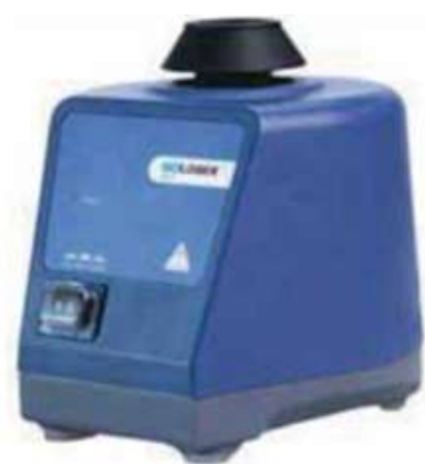
SCI-O180-Pro Agitador orbital digital LCD