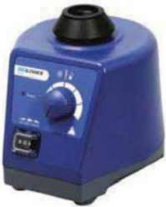
SCI-O330-Pro Agitador orbital digital LCD