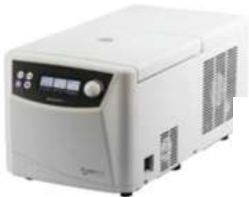
VELOCITY 15R Pro

La Velocity 15/15R Pro ofrece una centrífuga compacta y exquisita con una impresionante velocidad máxima de 15.000 RPM (22.302 x g). Tiene a su vez, una interfaz amigable, una perilla ajustable simple de presionar y girar, es fácil de configurar todos los parámetros de funcionamiento y muestra claramente la información de la centrífuga en estado de ejecución en la pantalla LCD