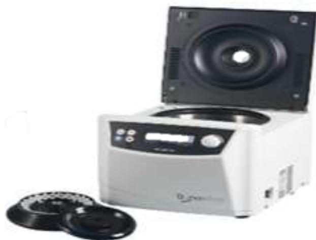
VELOCITY 15 Pro